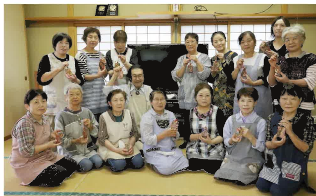
皆さんとってもいい顔してますね♪

今回は、一閑張りの基本を学ぶ講習会でしたが、皆さんさすがですね！小さいバックチャーム作りでも2～3日かかる作業ですが、先生も驚きの2時間半という短い時間で完璧に仕上げました。女性部の皆さんによる個性豊かな作品は、今月開催される曾慶地区生活作品展で展示されます。