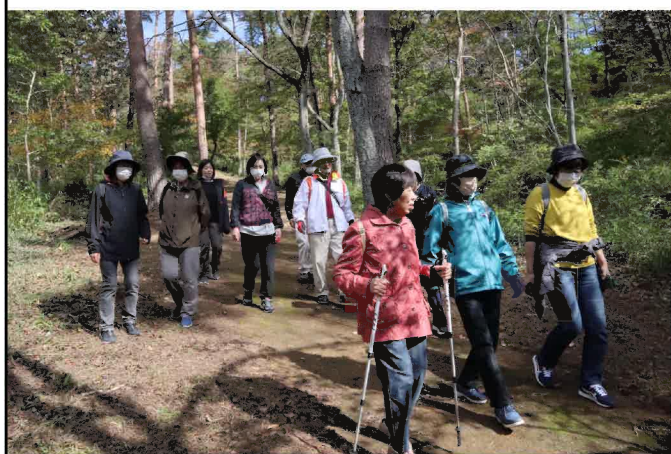
会話を楽しみながら古都の山道をウォーキング♪

10月19日、今年度最後になるウォーキング教室を開催しました。今回も曾慶地区のみでのウォーキング教室でしたが天候にも恵まれ、13名の参加者と一緒に平泉ウォーキングトレイルを歩きました。中尊寺から毛越寺にかけてのアップダウンの山道を約4キロ、紅葉時期には少し早かったです。普段は見ることのできない平泉を落ち葉を踏みしめながら、楽しく歩きました。今回初めてウォーキング教室に参加した方もいらっしゃいましたが「楽しかった。機会があったらまた参加したい」と感想を話してくれました。