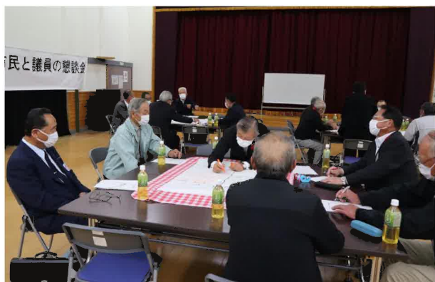
議員さんが進行等を務めたワークショップ

10月6日、曾慶地区センターを会場に市民と議員の懇談会が開催されました。議会活動報告があった後、「地域協働体の成果・運営課題」「解決が難しいと感じる課題」「議員・議会に求めること」など3つのテーマに基づきワークショップ形式で意見交換が行われました。参加者からはさまざまな意見や提言が出され、グループ毎に発表が行われました。出された提言等は今後の議会活動や運営等に生かされます。