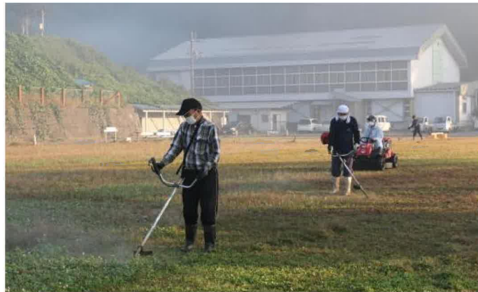
朝もやの中、グラウンドに結集した役員さん方が一斉に草刈りを行いました。

10月2日の早朝、結いネットそげい役員による曾慶グラウンドと曾慶農村公園の草刈りが行われました。身が引き締まるような爽やかな空気の中、参加した25人の役員さん方は一斉に草刈り機の音を響かせながら草を刈ると女性役員さん方は手際よく草を集めていました。また、同時に農村公園も草刈りを行い、グラウンドも農村公園も1時間半ほどですっきりと爽やかにになりました。さらに同時に曾慶遺族会では忠魂碑の洗浄作業を行い、碑の見事な偉容が際立ちました。