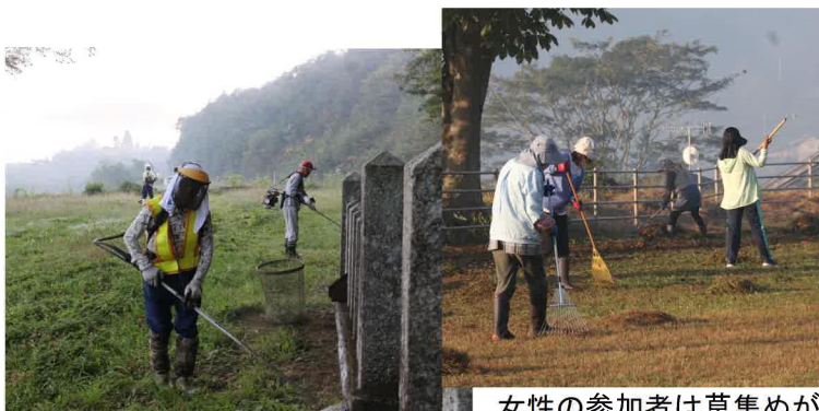
農村公園では刈り払いと遺族会による忠魂碑の洗浄が行われました

今年度から曾慶グラウンドは市民センターと共に結いネットそげいによる指定管理に、農村公園の管理は老人クラブ連合会から結いネットそげいへの委託になり、これまででは特定の人への負担が大きくなっていることが課題でした。今回は役員で実施しましたが、今後さらに協議を進め、曾慶地区全体による管理を進めていくこととなります。作業に携わった皆さん、早朝よりお疲れ様でした。