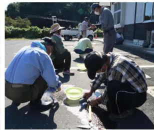
恒例になった剪定前の「刃研ぎ」。これが何より大事なのです。

どと個別に指導を受けながら刈り込みに精を出しました。爽やかな青空の下、休憩を挟んで2時間半ほどの作業でしたが、市民センター周りは劇的にすっきりとなりました。参加した皆さん、ありがとうございました。