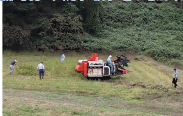
コンバインによる刈り取りを行いました

7月30日に播種をしたそばが刈り取りの時期を迎え、10月3日に刈り取りが行われました。水はけが悪いなど畑の状態が悪いところや畑の半分ほどをシカに食べられるなどの被害もありましたが、昨年より2割減の132kgの収穫（乾燥調整前）となりました。