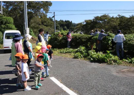
剪定作業中に保育園児が散歩で立ち寄り可愛い声援に作業にも気合いが入ります。