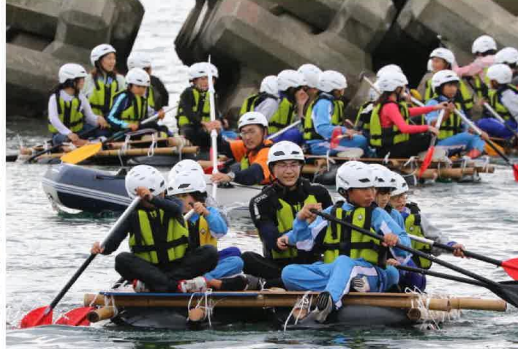
自分たちで組み立てたいかだに乗ってワクワク体験！

新型コロナ感染拡大の影響により3年ぶりの開催となった大東ジュニアサマーキャンプは8月2日と3日、陸前高田市広田町にある県立野外活動センターにおいて開催され、大東・大原両小学校の4年生から6年生ま