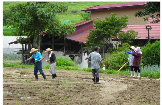
種まきに精を出すチーム員の皆さん

播種から65日後が刈り取りの適期となっています。新型コロナウイルス感染症の影響で、そげい夏まつりの開催やそば提供が難しい状況ではありますが、たくさん収穫し皆さんに提供できることを願いながら汗を流しました。