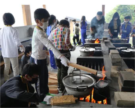
煙い中、かまどでご飯を炊いたりカレーを煮たり頑張りました。

新型コロナ感染拡大の影響により3年ぶりの開催となった大東ジュニアサマーキャンプは8月2日と3日、陸前高田市広田町にある県立野外活動センターにおいて開催され、大東・大原両小学校の4年生から6年生ま