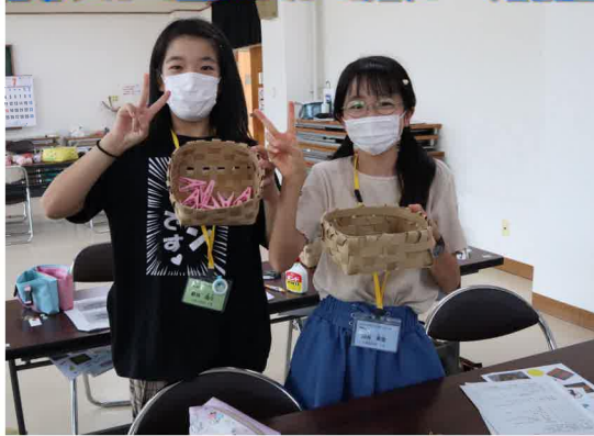
さすが5年生！とってもきれいな形に仕上がりました。早速活用中 (◡‿◡)

れましました。 工作では、クラフトバンドで小物入れを作りました。少し難しい工程もありましたが、出来上がりを楽しみに頑張って作業をしていました。手作り小物入れにおやつを入れてもらい、嬉しそうに食べていました。最後に学んだことを文章にまとめながら、イラストを書いたり、貼ったりそれぞれパンフレット制作をしました。