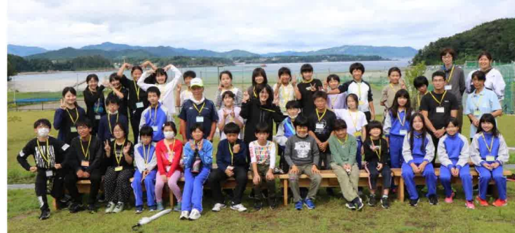
海をバックに記念撮影

での36人が参加しました。野外活動センターに到着した一行は、入所式や班づくり、昼食の後、いかだ体験をしました。材料となるタイヤチューブ等を持って海岸まで移動してから、班ごとに組み立てたいかだに乗って海に漕ぎ出しました。ほとんどが初めての体験に、子供たちは戸惑いながらもワクワクした表情でオールを漕ぎ、石浜海岸には歓声が響き渡っていました。