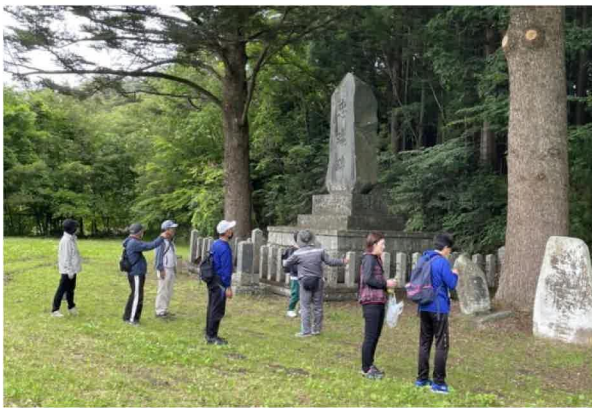
忠魂碑を初めて見る参加者からは、その偉容に驚きの声が上がっていました。

参加者からは「久しぶりに皆さんと歩いて楽しかった」「知らない道を歩くのは楽しい」などと感想をいただきました。