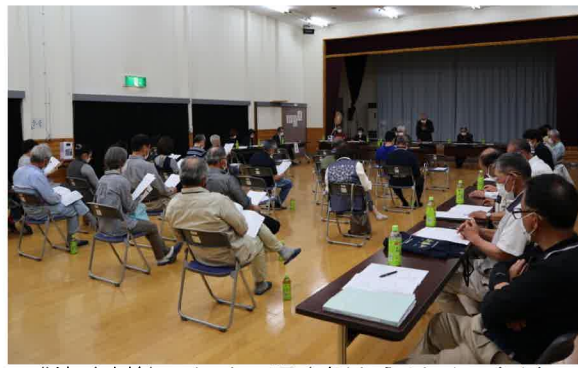
感染症対策のため、理事側からはチームリーダーのみの出席としました。

「結いネットそげい」の令和4年度総会は6月17日に曾慶地区センターで開催、各自治会から選出された代議員31名(内委任状13名)が出席し、10日の理事会を経た案件が審議され、すべて原案通り可決されました。審議された案件は次のとおりです。 ▽議案第1号：令和3年度事業報告並びに収支決算について