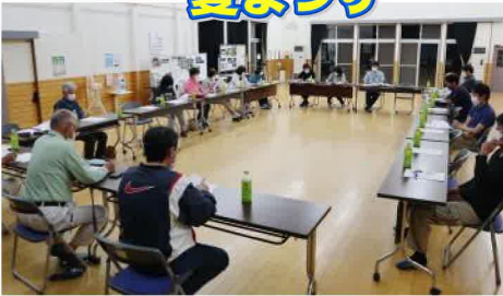
6月22日に開催した夏祭りチーム会議

新型コロナの感染拡大に伴い令和2年度より開催を見送っていた「そげいの夏まつり」ですが、6月22日にチーム会議を開催し、祭り開催の可否について話し合いました。その結果、感染対策を徹底した中で8月20日(土)に開催することが決定いたしました。開催内容等詳細については、これからのチーム会議等で検討していきますので、みんなで楽しい祭りにしましょう!