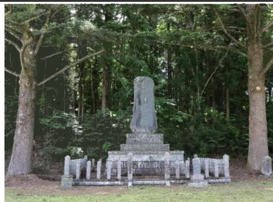
曾慶百景 忠魂碑 (ちゅうこんひ)

曾慶農村公園内にある忠魂碑は、在郷軍人会渋民村分会評議会(分会長は勝田文英氏)の声かけにより、日清・日露戦争に出征した曾慶出身の戦没者を慰霊するため、当時の渋民村が村有地として買い入れ、村内全域から寄付金を募り建立。大正9年10月26日に除幕式並びに招魂祭が行われました。一昨年が建立から100年の節目でした。曾慶農村公園としては旧大東町が整備し、昭和58年4月2日にオープン。子供たちの遊び場、桜の名所としても親しまれてきました。