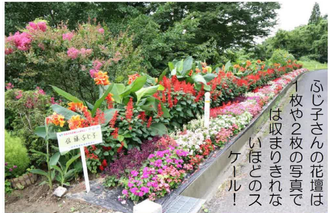
ふじ子さんの花壇は1枚や2枚の写真では収まりきれないほどのスケール!