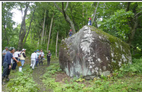
曾慶百景 箱石 (はこいし)

4区の山ノ沢地内にあり、二ノ上山頂(345m)に向かって行く途中にある大きい石です。下から見上げるとその存在感に圧倒されます。一番高いところは地上から4m、長さは6m程もあり、上面は2畳以上もあって5～6人は座れます。古い言い伝えによると、天下太平、雨乞い、五穀豊穰、悪虫防除等を祈願した石と言われています。昔は農作業が一段落すると、地元の人たちが石の上で景色を眺めながらお酒を酌み交わし、おさなぶりをしたそうです。