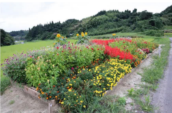
地域の部 銅賞 曾慶第13区自治会