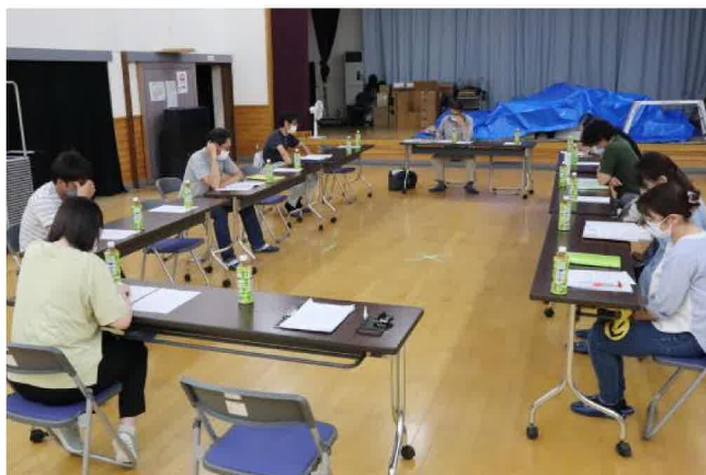
会議は楽しく和気あいあいと