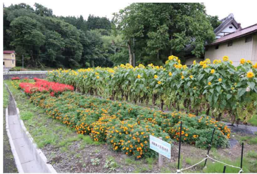
地域の部 奨励賞 曾慶第4区自治会