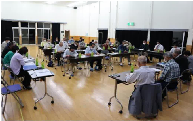
理事・役員のほぼ全員が出席し、活発な意見が出されました。

市道大東千厩線（曾慶工区）の道路改良については、平成29年度に早期着工・完成の要望を出していましたが、用地取得が難航し曾慶工区は未だにルート決定にも至っていませんでした。地域の優先順位一番