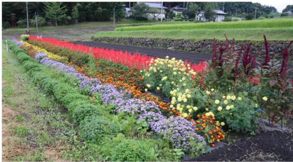
地域の部 銀賞 曾慶3区小森班

今年度新設された部門です。新たにコンクールに応募した花壇が対象です。 ※ 地域審査のみ