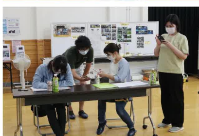
早速LINE交換とグループ作成サクサクできるのも若者です