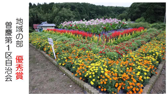
地域の部 優秀賞 曾慶第1区自治会