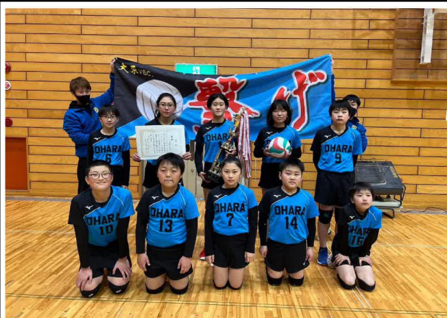
第27回一関市東地区小学生バレーボール大会 大原バレー ボールクラブ すこいぞ優勝!!

現在12名で活動している大原VBC（大原バレーボールクラブ）のスポ少チームが、1月28日に千厩体育館で開催された『第27回一関市東地区小学生バレーボール大会』で優勝しました。