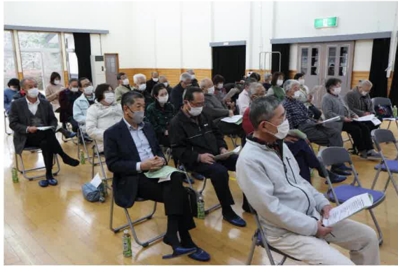
30人を越える参加者が聴講しました

曾慶市民センター成人講座は「生涯現役、天職探しと実践」セカンドライフは、健康で豊かに自分らしい生き方」をテーマに2月15日、曾慶地区センターで開催し、地区内外から30名を超える皆さんが参加しました。講師を務めたのは、ヒュー