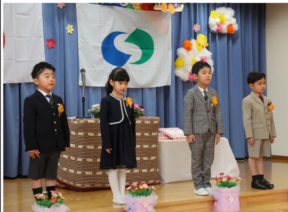
大きく成長した姿を見せた4人

曾慶保育園の卒園式が3月8日に同園を会場に行われ、ご両親や在園児、来賓、保育園職員らが見守る中、4人の卒園をお祝いしました。