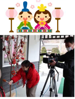
子どもたちからも歓声があふきました