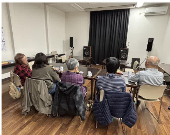
月1回の語らいの場となっています

一昨年暮れからスタートした音楽喫茶「結」は、レコードなどで音楽を聴きながら、コーヒーや会話を楽しむ場としてスタートしましたが、毎回来ていただく方もいて、定着したように思います。15回目となった3月22日には、初めて来店した方も2人いて、懐かしい昭和時代の歌謡曲などを聴きながら、話にも花を咲かせました。参加者のひとは「ふだん会話をしたことがない人とも会話でき、このような場は必要」と話していただきました。最後にはギター伴奏で懐かしい歌もみんなまで歌い、楽しいひとときを過ごしました。