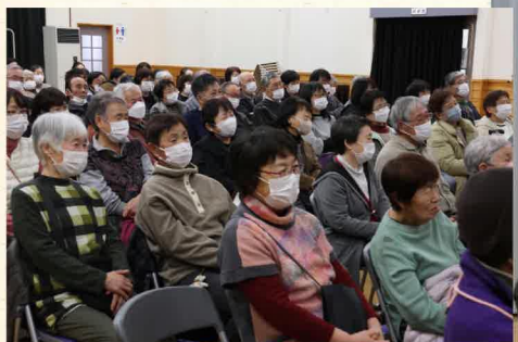
会場は笑い声と笑顔で包まれました